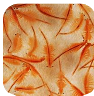
อาร์ทีเมีย หรือ ไรน้ำเค็ม (Artemia)