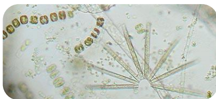
แพลงก์ตอนพืช (phytoplankton)